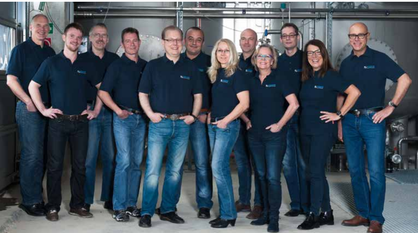
TeamWork ist bei der KRINNER Drucklufttechnik GmbH weitaus mehr als nur ein Wort.